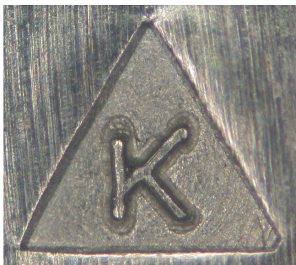
Znak imienny składający się z jednej litery