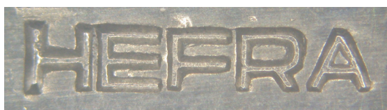
Znak imienny z nazwą przedsiębiorstwa