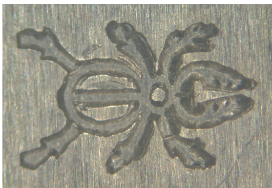
Znak imienny – symbol żuka