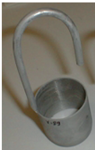
Piknometr do lodów

Zgodnie z art. 4 ust. 1 „Ustawy o towarach paczkowanych” nadzorowi organów administracji miar podlega paczkowanie produktów, a w szczególności stosowany przez paczkującego system kontroli wewnętrznej ilości towaru paczkowanego. Nadzór ten administracja miar sprawuje na warunkach i w trybie określonym w ustawie „Prawo o miarach”. Do zadań dyrektorów okręgo-