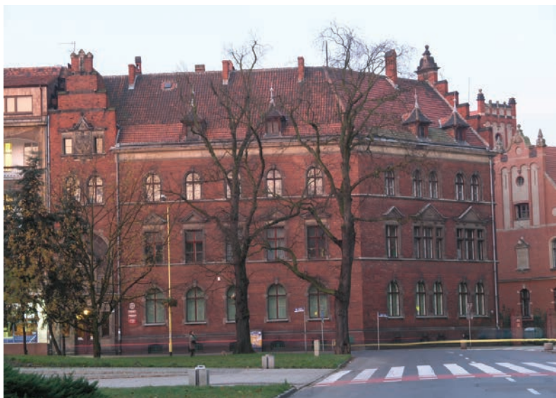
Siedziba Okręgowego Urzędu Miar w Szczecinie