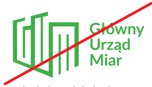
użycie innych kolorów

Niedopuszczalna jest zmiana koloru oraz użycie przejść tonalnych i gradientowych w obrębie logotypu. Nie wolno zniekształcać i obracać logotypu.