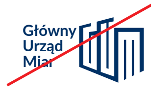
zmiana położenia tekstu