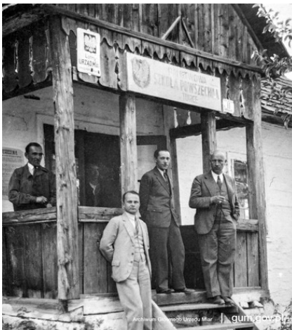
Wizytacja Lotnego Urzędu Miar w Turce k. Stryja, 1933 r.