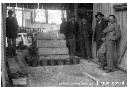
Sprawdzanie wagi wozowej przez pracowników polskiej administracji miar, Betz k. Żółkwi 1932 r.