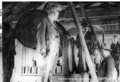
Sprawdzanie zbiorników do ropy naftowej przez pracowników polskiej administracji miar, Schodnica 1932 r.