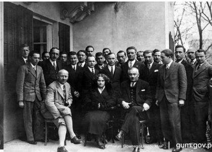
Uczestnicy zjazdu kierowników Okręgowego Urzędu Miar we Lwowie, ok. 1932 r.