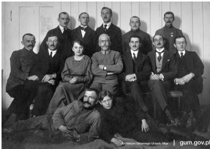
Pracownicy Urzędu Cechowniczego w Lublinie, 1918 r.

Wybuch II Wojny Światowej trwale zmienił układ granic dzisiejszej Rzeczypospolitej, zmieniając także strukturę polskiej administracji miar. Zmiany te w sposób szczególny zaszły na terytorium dawnej Rzeczypospolitej, czyli na Kresach Wschodnich.