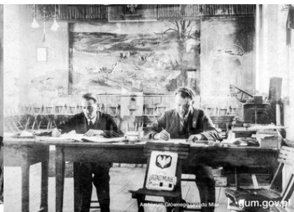
Pracownicy Lotnego Urzędu Miar przy wykonywaniu obowiązków służbowych, 1931 r.