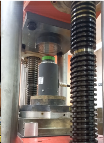
maszyna wzorcowa siły