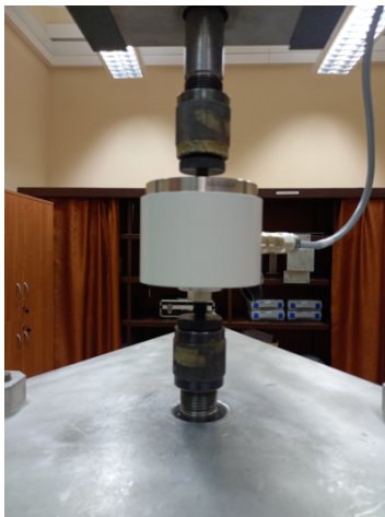
przetwornik siły w trakcie wzorcowania